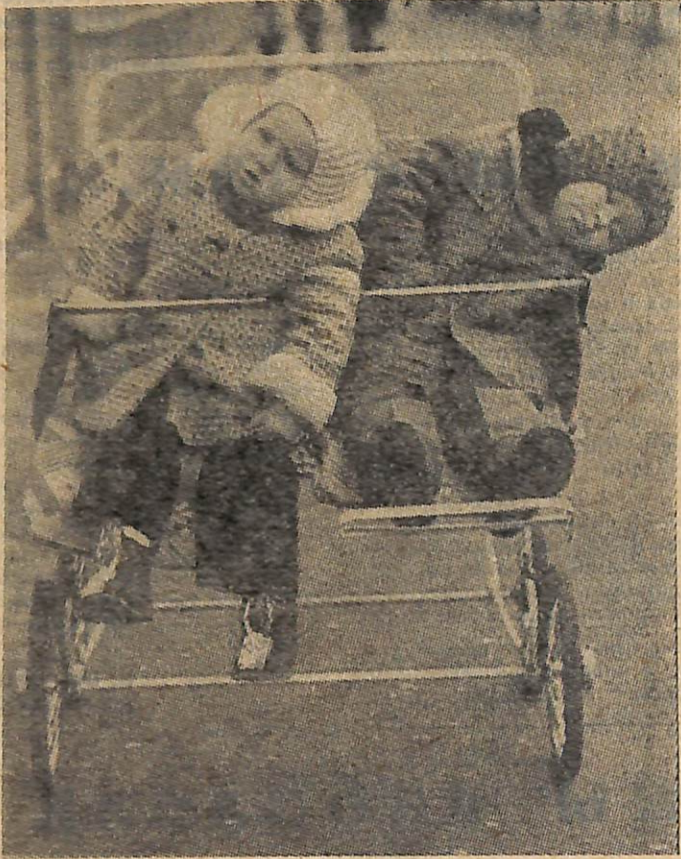
«ТОСКА». «ОСЕННИЕ АККОРДЫ». Фото В. ГОЛУБЕВА (цех № 33).

Счастливые лотерейные билеты можно приобрести у секретарей комсомольских организаций, предцехкомов. Цена билета — 30 коп. Комитет ВЛКСМ.